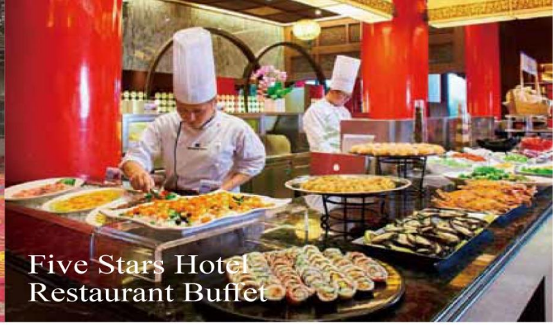
Five Stars Hotel Restaurant Buffet